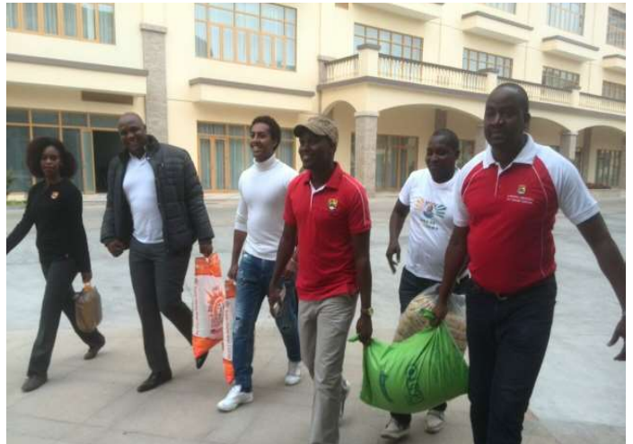
União e Solidariedade entre os moçambicanos